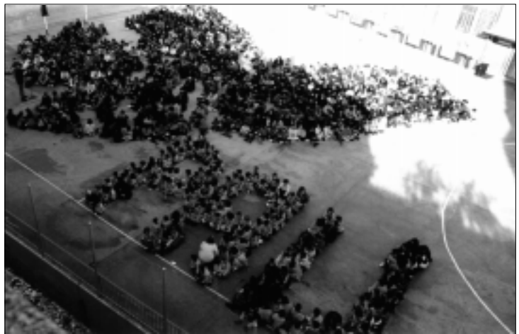
Mosaic dels alumnes de Sitges, en la Diada Internacional per la Pau.