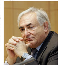
Dominique Strauss-Kahn, Director gerent del FMI.

Per què el Fons Monetari Internacional ( FMI ) feia aquesta afirmació? Quin és el missatge que s'intenta transmetre des d'aquesta institució?